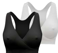
Keep Cool™ Nočná