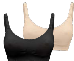
Keep Cool™ Ultra