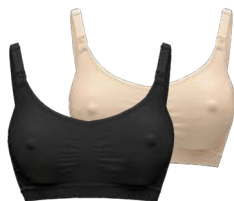
Keep Cool™ Dojčiacia